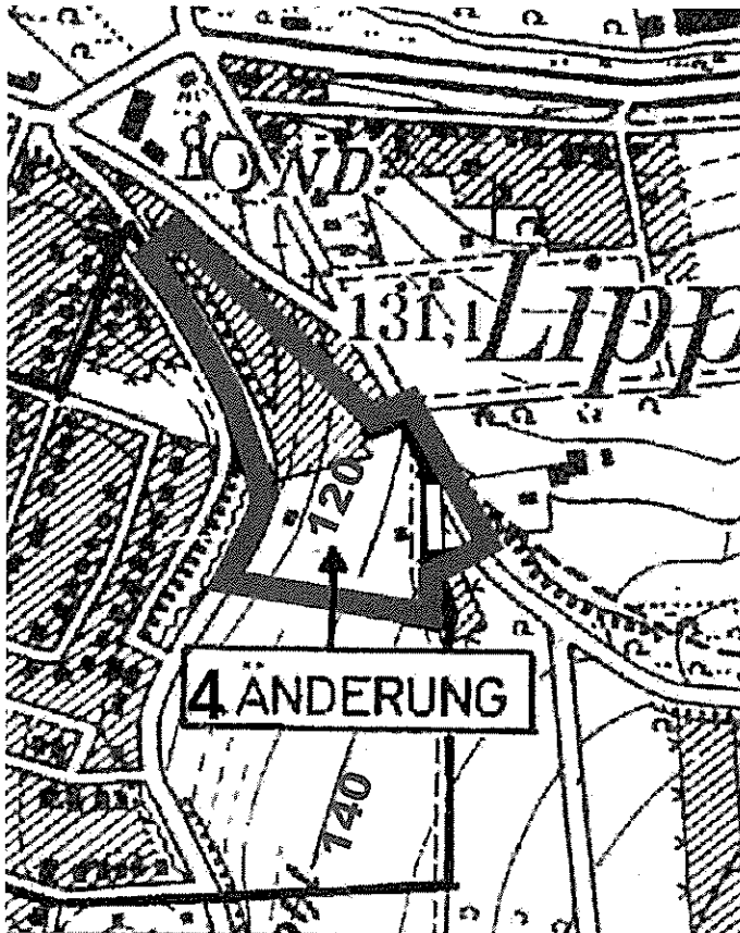
Geltungsbereich BP Nr. 1, Änderung Nr. 4 Übersichtsplan ohne Maßstab

Die Gemeindevertretung der Gemeinde Wahlsburg hat in ihrer Sitzung am 9.12.2009 den Bebauungsplan Nr. 1, Änderung Nr. 4 „Hohe Breite, Auf dem Schild, im Sebig, Im Seweg und Saurasen“ gemäß § 10 Abs.1 BauGB als Satzung beschlossen.